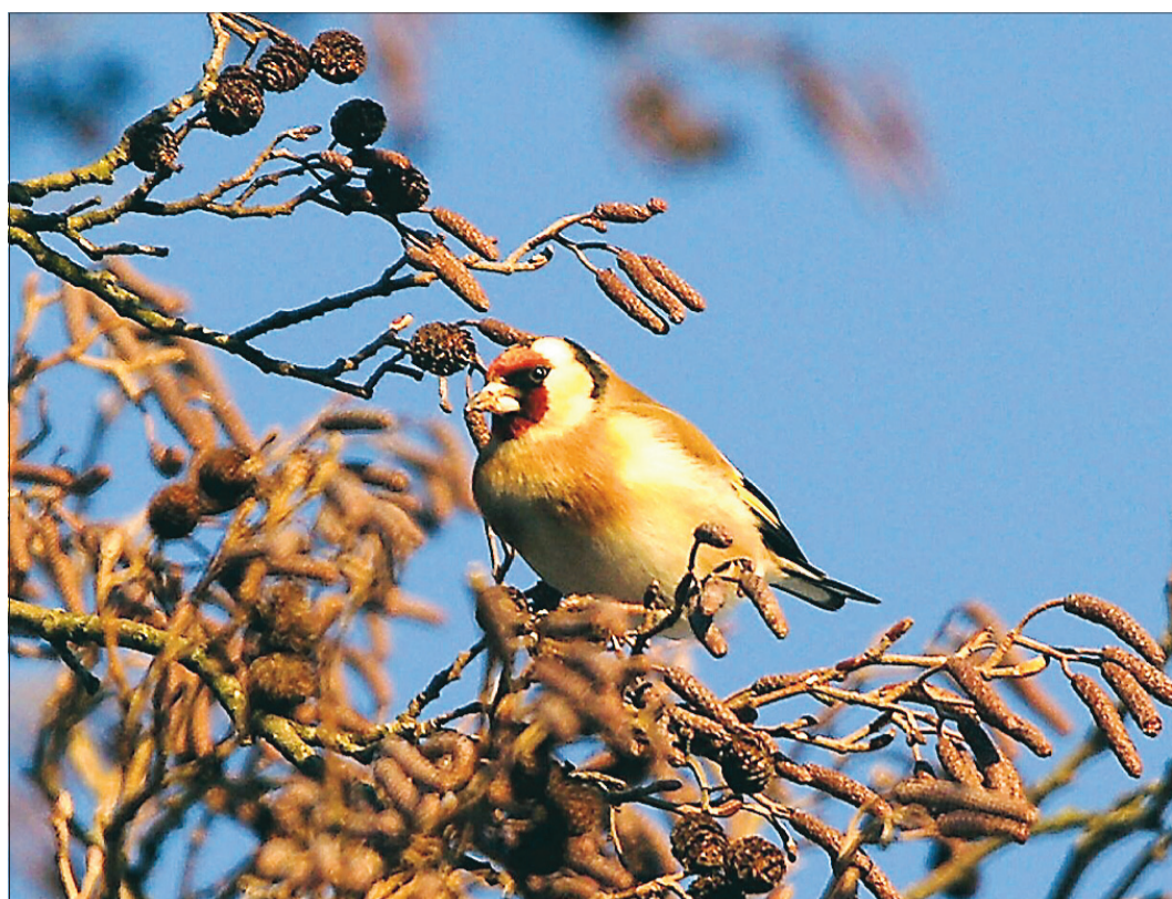
Ein Distelfink, auch Stieglitz genannt, sucht im vereisten Baum nach Nahrung. Allzu selten sehen LZ-Leser in letzter Zeit dieses Bild.

Erika Müller empfindet als „ärgerlich“, dass in Berichten über Margot Käßmann immer wieder auch über die Alkoholfahrt der ehemaligen Bischöfin berichtet wird: „Sie ist zurückgetreten und hat damit Verantwortung übernommen.“ Viele Politiker seien nicht so konsequent, wenn sie bei einem Fehlverhalten erlappt werden. LZ-Politik-Chef Werner Kolbe entgegnet: Der Fakt sei wichtig, um Käßmanns Entwicklung zu verstehen. Zum Verständnis müsse erklärt werden, warum Käß-